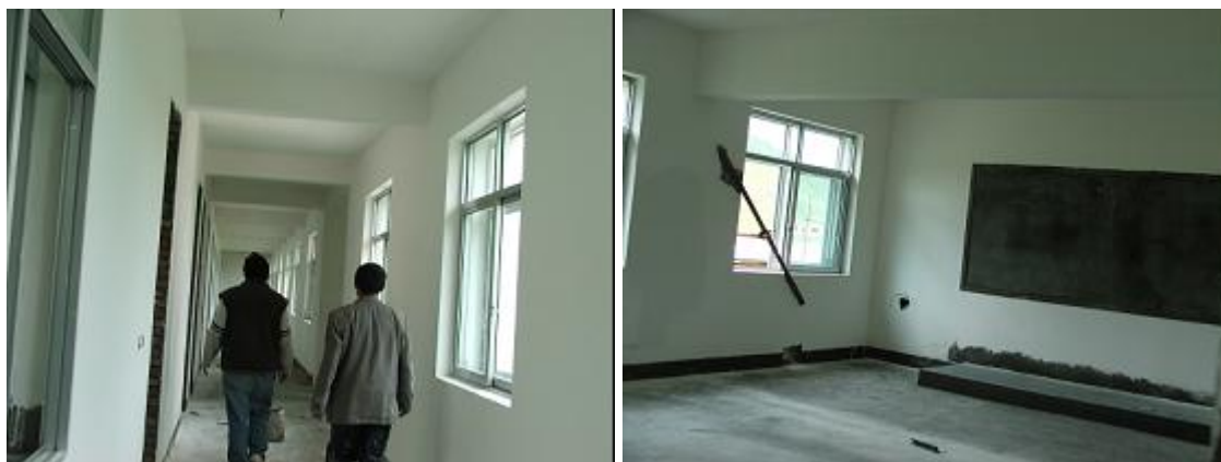
Foto's van bouwfase 3B Gesar Sherab school (situatie najaar 2007)