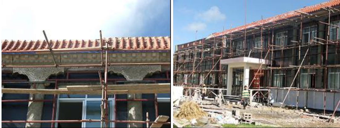
Foto's van bouwfase 3B Gesar Sherab school (bouw in volle gang augustus 2007)

De communicatie met SSG blijft goed en voldoende frequent. Hierdoor is goede afstemming van werkzaamheden en financiën goed mogelijk. Eind 2007 waren op Gesar Sherab School circa 300 kinderen die les krijgen op onze school. Zij verblijven er 9 maanden continu. De organisatie van de school groeit goed mee. Er zijn momenteel 14 full time onderwijzers en 3 school koks. De onderwijzers geven ieder verschillende vakken. De gemiddelde klasbezetting is ongeveer 30 kinderen per klas (er zijn in totaal 8 klaslokalen). Er zijn vooral veel jonge kinderen. De eerste klas heeft 4 groepen. Dit legt wel druk op de klaslokalen voor de toekomst. In de tussentijd zijn er ook nog eens 400 nomadenkinderen van de leeftijd 16 tot 24 jaar getraind met kortere programma's om deze groep ook basale vaardigheden als lezen en schrijven bij te brengen. Al met al een groot succes.