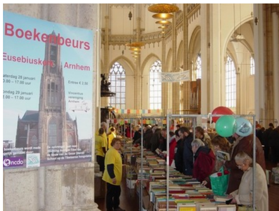
2 de hands Boekenbeurs Vincentius (januari)