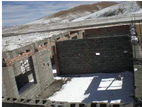
Foto's van bouwfase 3A Gesar Sherab school (situatie najaar 2006)