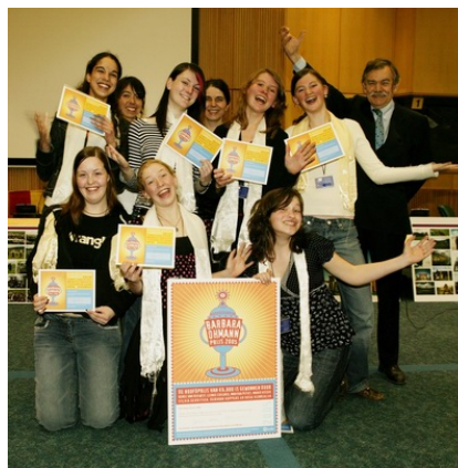
Uitreiking Ohmann prijs (maart)